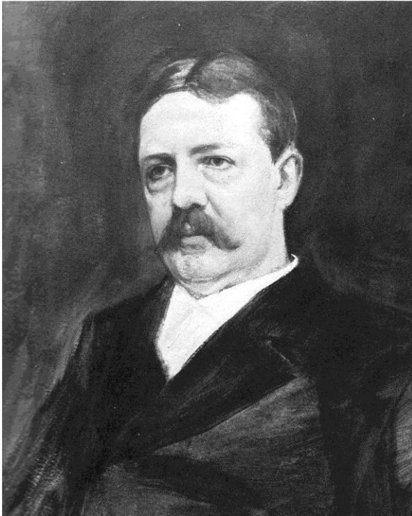
Oscar Björck: Viktor Rydberg. Olja, 1895.

Emerik Stenberg såg antagligen sin etsning som en chans att tjäna pengar och komma igång med karriären, men Björck tycks inte ha haft några sådana ambitioner med sin målning. Han behöll den nämligen själv i trettio år, innan han skänkte den till Stockholms högskola. 4 Kanske vågar man gissa att han främst gjorde den som ett minne och ett tack för hjälpen.