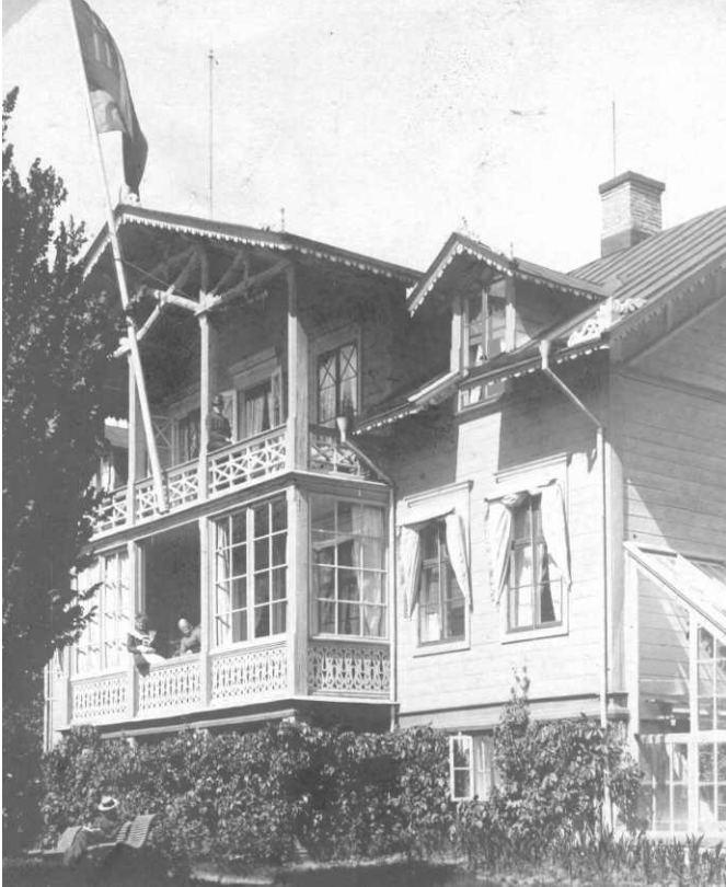
Närbild på huset. Fotot är taget 1901, efter förvandlingen till lärarinnehem; annars hade man kunnat tänka sig att den läsande figuren på soffan nere till vänster var Rydberg.