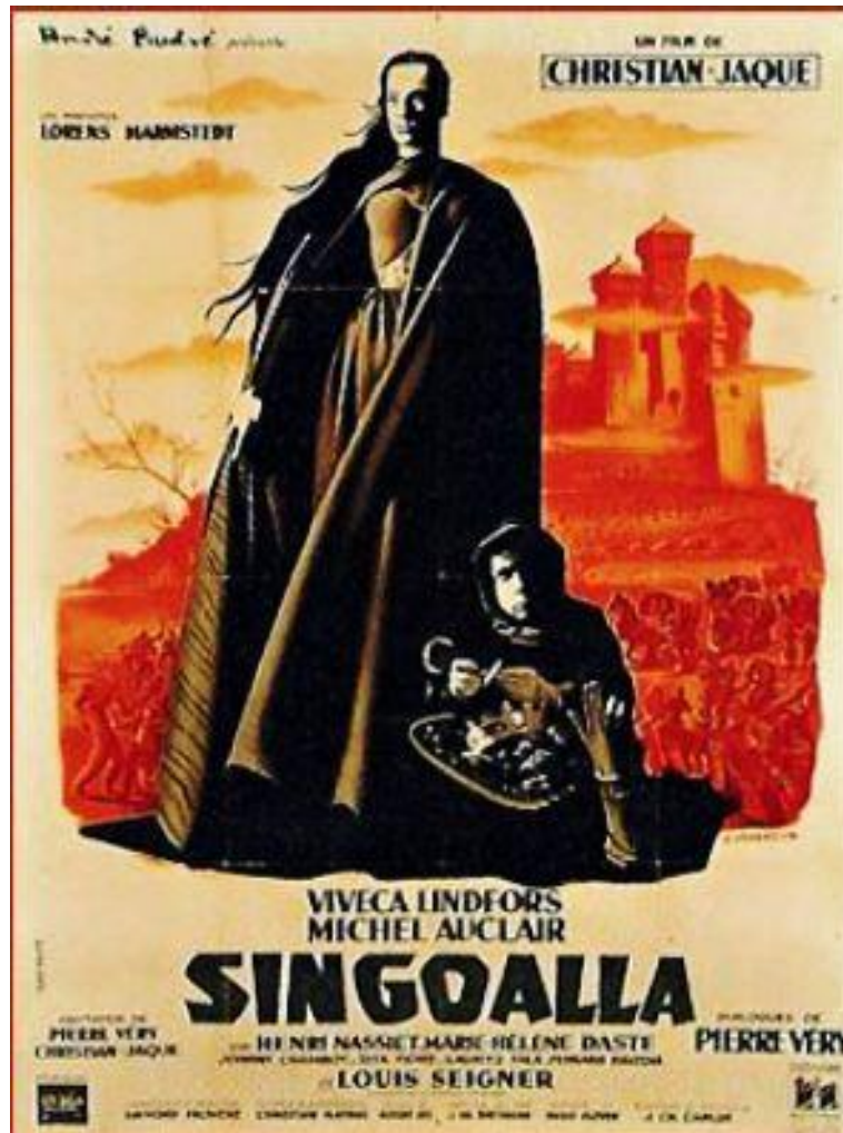
Affisch för den franska versionen av Singoallafilmen från 1949.

elektroniska nyheter från Viktor Rydberg-sällskapet mars 2010