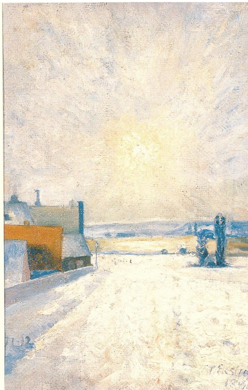
Per Ekström, Vintermotiv från Roslagstull (1891)