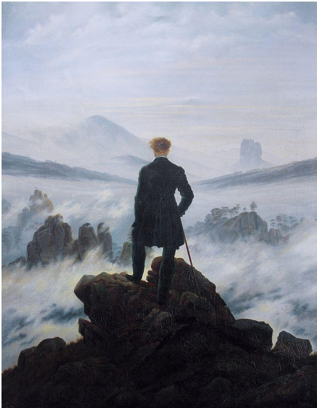
Caspar David Friedrich: Vandraren i dimhavet (1818)