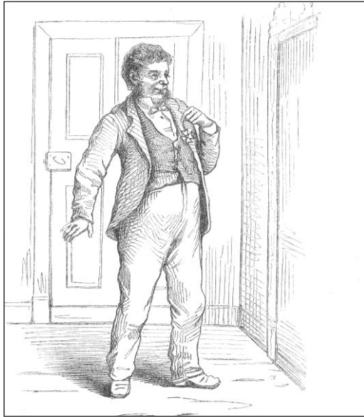
Petit Vigg innehåller sju av Nyströms åtta textillustrationer, men inte denna.

radikala innehåll, och särskilt dess drift med ordensväsendet, som är problemet. Vilket verkar rimligt, i synnerhet som en av Nyströms teckningar – den med den löjliga ordensmottagaren – tycks ha förhandlats bort redan under tryckningsfasen.